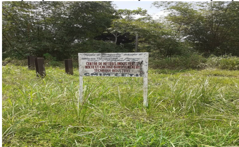
Centre des Métiers Industriels Mixtes et Collège d'Enseignement Technique Industriel (CMIM-CETI)

La formation professionnelle et technique, qui pouvait préparer les jeunes et populations de Linzolo, à une insertion professionnelle, n'est assurée que par un collège mixte des métiers industriels, dont les activités de formation, nécessitent un renforcement des capacités tant, du point de vue humain que matériel. Ce collège technique, ne dispose pas vraiment d'ateliers, pour des activités pratiques.