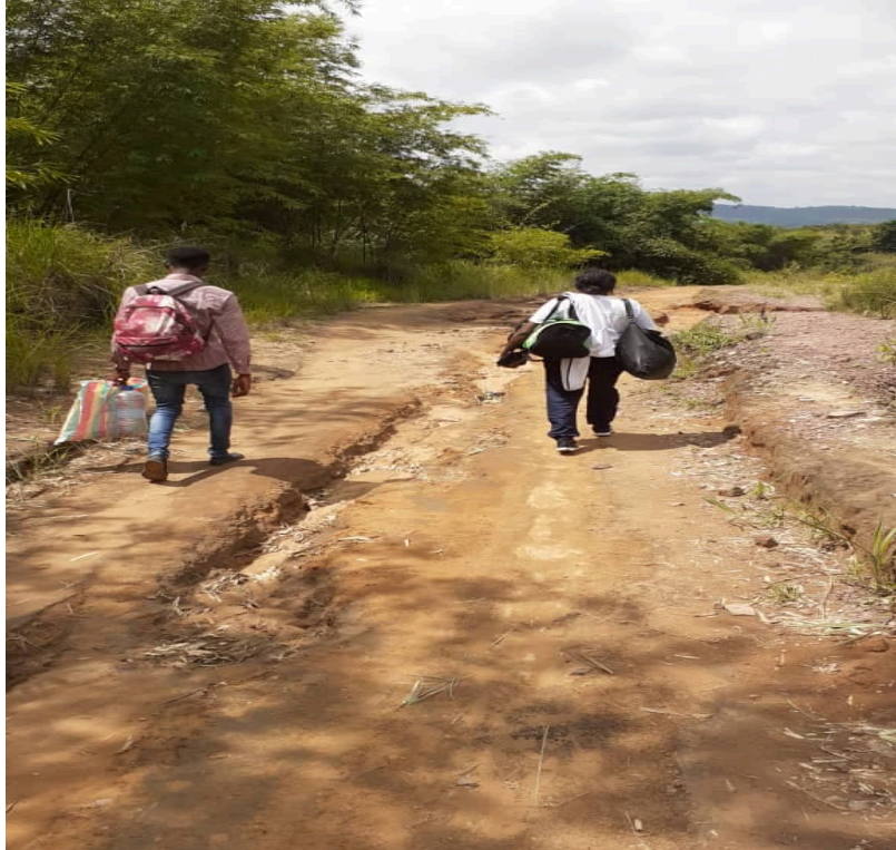
Deux membres délégués de la mission enteraient d'atteindre le village de Linzolo à pieds, après l'embourbement du véhicule les transportant à destination

Après avoir quitté Brazzaville le Samedi 1 février 2020 au matin, la délégation est arrivée vers 11h00 à Linzolo, dans des difficiles conditions de circulation et de transport en raison de la très mauvaise qualité de la route, très fortement endommagée. Les délégués de la dite mission, ont même été obligés de parcourir quelques distances à pieds.