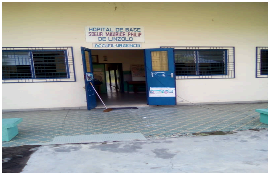
Hôpital de base de Linzolo

Dans le domaine de la santé, l'offre sanitaire reste fournie principalement par l'hôpital de base, sœur Maurice Philip de Linzolo, qui aujourd'hui est dépourvu des moyens matériels et humains. En effet, cet hôpital qui jadis recevait plusieurs patients, en provenance même de Brazzaville, affiche aujourd'hui un mauvais état. Parmi les nombreux facteurs justifiant cet état, on peut citer : l'instabilité persistante en raison des multiples guerres récurrentes, l'appauvrissement de la population locale et, le délabrement de la route menant à Linzolo.