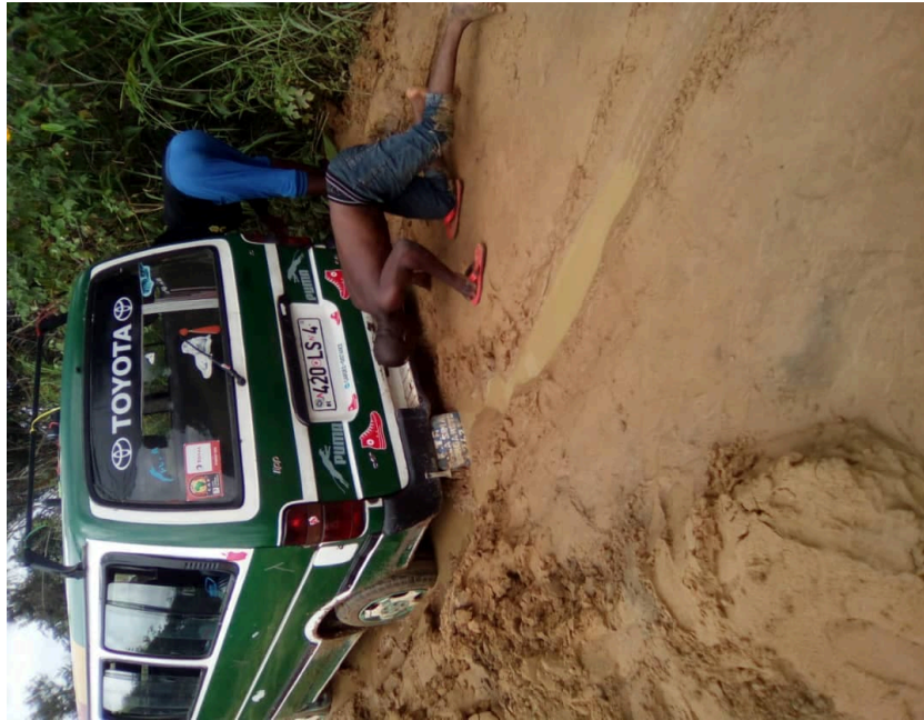
Autobus embourbée sur la route de Linzolo

Beaucoup d'enseignants s'abstiennent de leurs postes de travail, à cause des mauvaises conditions de transport de la route menant à Linzolo, qui, avant les nombreuses guerres du Pool, reliait Brazzaville, que d'une trentaine minutes.