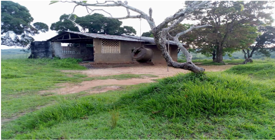
Cloche de l'école et, bâtiment scolaire détruit

Les établissements de formation des jeunes et adultes de la localité, demeurent ainsi dans un fort état de délabrement total et, nécessitent une assistance immédiate. Le taux d'abandon qui a fortement augmenté dans les écoles de la place, appelle à une prompte réponse et, une stratégie pouvant permettre aux jeunes de rester et, terminer leurs études.