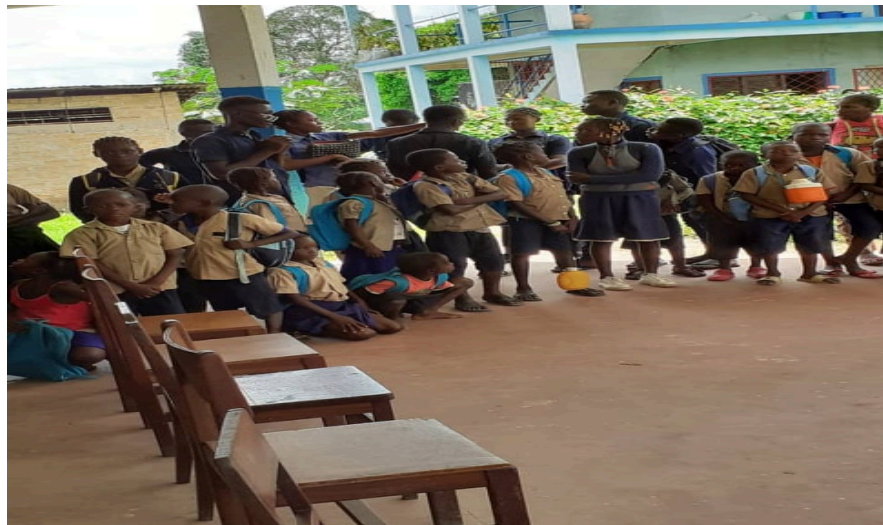
Élèves lors du lancement de la Bibliothèque