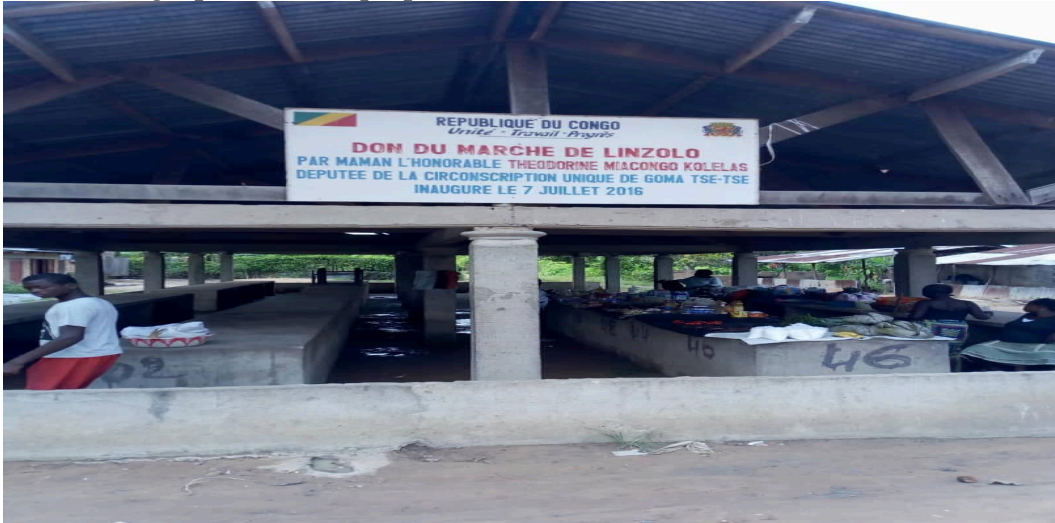
Autre vue du marché de Linzolo

La situation socioéconomique de la localité reste donc semblable à celle constatée dans tout le pays, et s'explique entre autre, par la persistante crise économique, que traverse par le Congo, déjà depuis quelques années. La pauvreté, de plus en plus croissante constatée localement, reste aussi justifiée par un manque d'opportunités économiques et, le développement d'un entrepreneuriat local, malgré les opportunités agropastorales, qui peuvent être suffisamment valorisé.