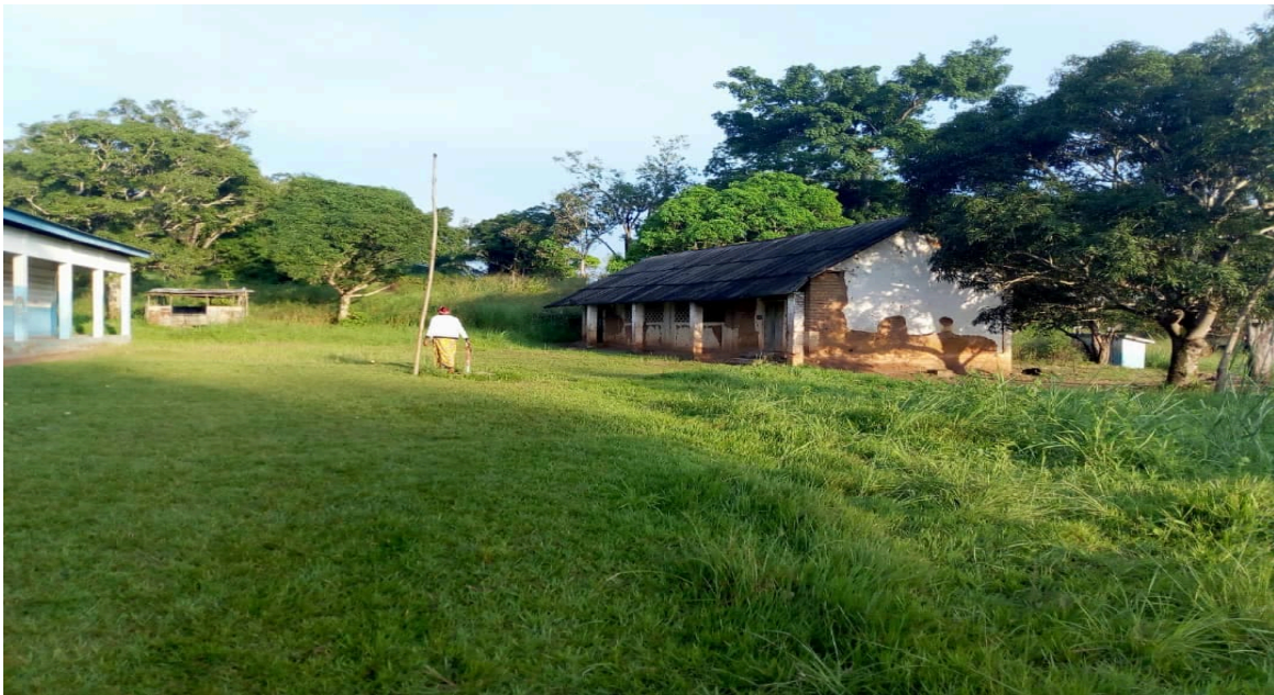
Autres bâtiments scolaires

Les conditions d'études méritent aussi d'être remédiées, notamment sur la qualité de l'offre scolaire, illustrée par un faible effectif du personnel enseignant.