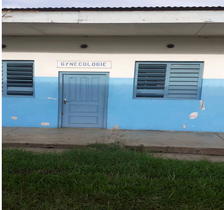
Le pavillon du Service de Gynécologie de l'Hôpital

Le bloc d'accouchement et les services de gynécologie obstétrique sont bien équipés et, fonctionnent normalement. Cependant l'extrême pauvreté de la population, ne permet pas aux patients de recourir en premier, aux services hospitaliers, préférant d'abord des soins traditionnels, tels les tisanes à la maison. L'environnement immédiat de cet hôpital, affiche aussi une mauvaise image. Il y a plusieurs herbes et, les sanitaires sont dans un piteux état.