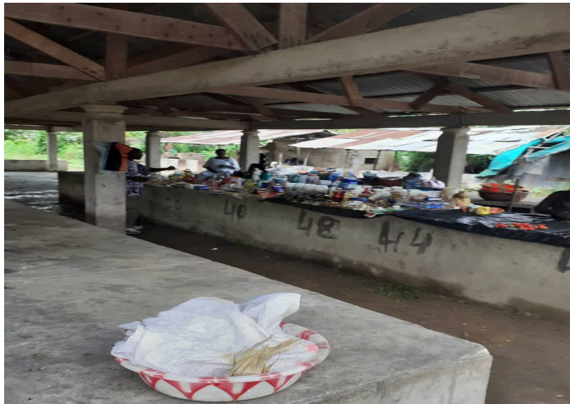
Marché de Linzolo

Le marché de la localité, qui jadis était beaucoup fréquenté avant les troubles politiques, a été réduit à quelques activités de ventes, avec plusieurs magasins fermés. Les producteurs de Linzolo, préférant aller commercialiser leurs produits aux marchés de Nganga Lingolo ou de Total à Brazzaville, pour en tirer, un plus grand bénéfice.