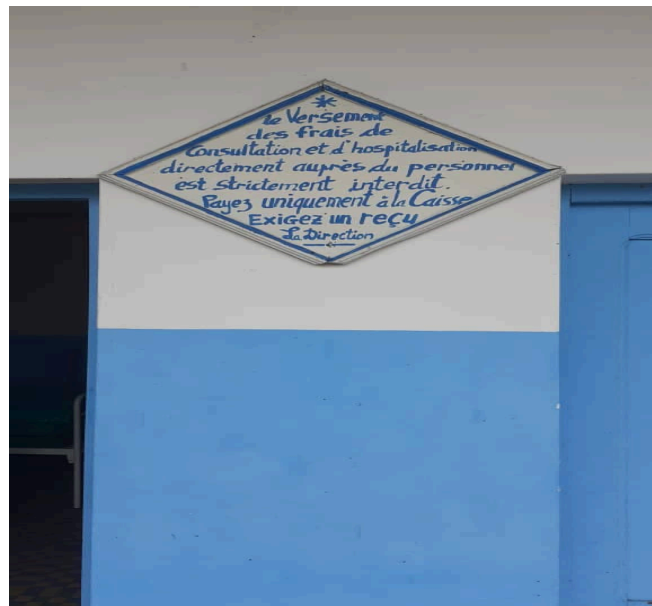
Tarification de l'hôpital

Le bloc d'accouchement et les services de gynécologie obstétrique sont bien équipés et, fonctionnent normalement. Cependant l'extrême pauvreté de la population, ne permet pas aux patients de recourir en premier, aux services hospitaliers, préférant d'abord des soins traditionnels, tels les tisanes à la maison. L'environnement immédiat de cet hôpital, affiche aussi une mauvaise image. Il y a plusieurs herbes et, les sanitaires sont dans un piteux état.