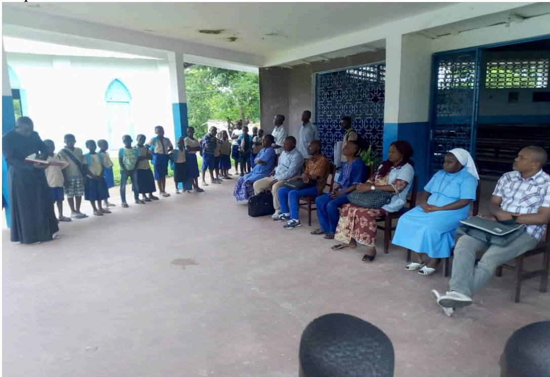
Lors de l'ouverture officielle de la bibliothèque à la paroisse catholique de Linzolo

Cette activité a aussi coïncidé avec le lancement officiel de la Bibliothèque catholique de la paroisse de Linzolo, en présence du chef de village, représentant le sous préfet du District de Goma Tsé-tsé, d'autres autorités, personnalités et populations locales, dont les élèves, fidèles et populations, qui en sont les principaux bénéficiaires.