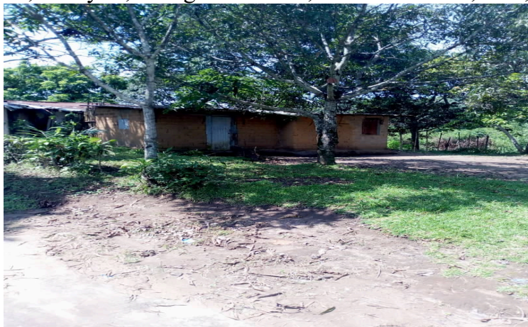
Une maison d'un quartier de Linzolo

Cette première journée a consisté à effectuer une prise de contact du milieu, avec au programme des échanges avec les populations, ainsi que plusieurs autres visites dans les huit (8) quartiers du village, que sont : Saint Isidore, Coin préféré, Kouboula koutou, Mouyeri, Mongo moussaki, Shimou linzolo, B52, Saint Pierre.